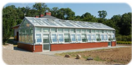
Szkółka Drzew i Krzewów